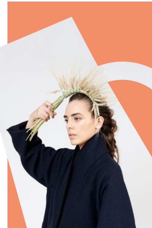
MODE DARYN CHOOK

Auf der BLICKFANG triffst du die Produkt-Designer:innen deines Herzens persönlich. Ansprechen und das Entdeckte direkt shoppen ist ausdrücklich erwünscht. Dass du dabei noch Vieles über dein neues Lieblingsteil erfährst, bereichert umso mehr.