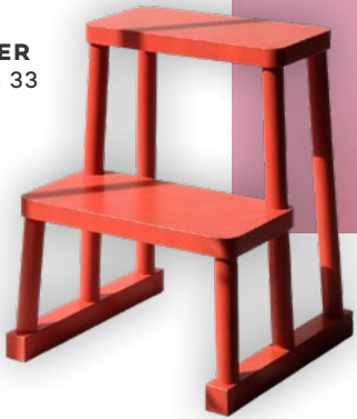
HOCKER Edition 33

Freue dich auf gleich zwei Sonderschauen an der BLICKFANG Wien: