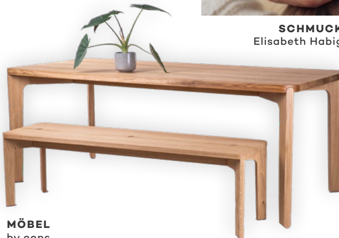
MÖBEL by oops