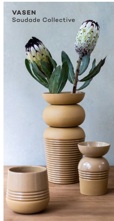
VASEN Saudade Collective

An der BLICKFANG triffst du die Macher:innen des Designprodukts deines Herzens persönlich. Ansprechen und das Entdeckte direkt shoppen ist ausdrücklich erwünscht. Dass du dabei noch Vieles über dein neues Lieblingsteil erfährst, bereichert umso mehr.