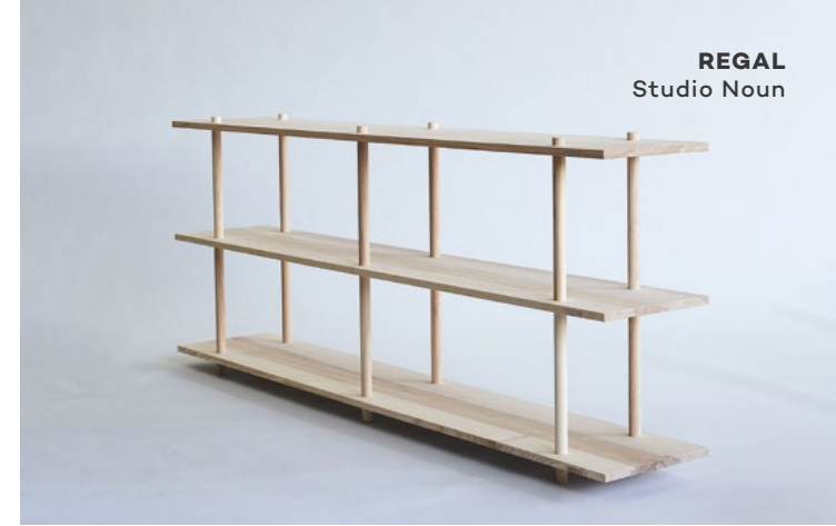
REGAL Studio Noun

Mit dem Kauf ihrer Produkte und Kollektionen unterstützt du vor allem die kleinen, meist unabhängigen Designlabels und sorgst ganz nebenbei für mehr Vielfalt in der Branche. Spannende Begegnungen und gute Geschichten inklusive.