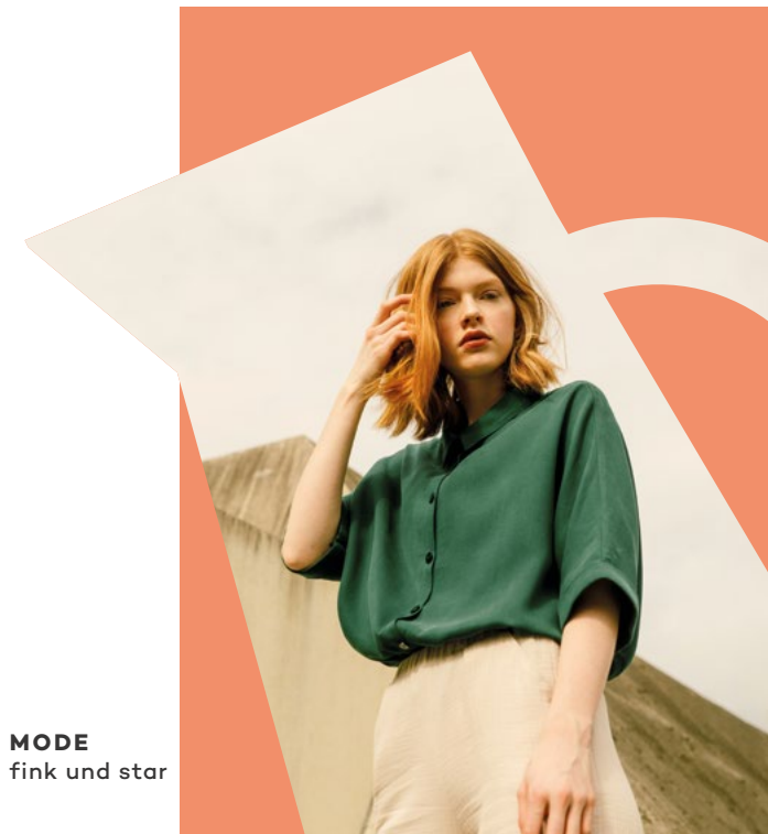
MODE fink und star