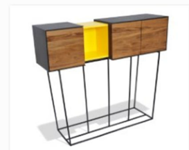
Moritz Pröll auf der internationalen Designmesse blickfang Wien(9).jpg