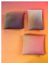
Case Studies auf der internationalen Designmesse blickfang Wien(1).jpg