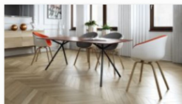
Harald Gorbach auf der internationalen Designmesse blickfang Wien.jpg