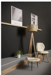
Almut auf der internationalen Designmesse blickfang Wien.jpg

Veröffentlichung auch den im Bildtitel angegebenen Designer.