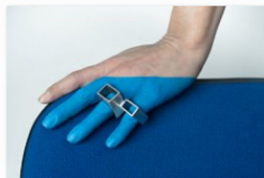
Kreisverkehr (2) auf der internationalen Designmesse blickfang Wien.jpg