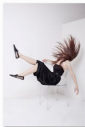
Dyan auf der internationalen Designmesse blickfang Wien (2).jpg