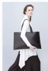
PBG Studio auf der internationalen Designmesse blickfang Wien (1).jpg