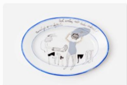
Maestrokatastrof auf der internationalen Designmesse blickfang Wien_Foto Kristina Hrabetova (1).jpg