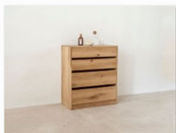
Hall auf der internationalen Designmesse blickfang Wien.jpg