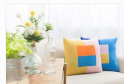
Studio Chiia auf der internationalen Designmesse blickfang Wien (1).jpg