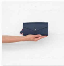
ffil auf der internationalen Designmesse blickfang Wien (2).jpg