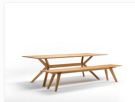
Hildinger und Koch auf der internationalen Designmesse blickfang Stuttgart.jpg