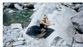
mueller & Consorten auf der internationalen Designmesse blickfang Stuttgart (1).jpg