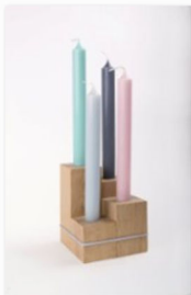
daheim seinauf der internationalen Designmesse blickfang Stuttgart (2).jpg

www.blickfang.com/presseportal/stuttgart.html , der Fotocredit lautet © blickfang . Bitte nennen Sie bei Veröffentlichung auch den im Bildtitel angegebenen Designer.