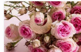
Inlace Jewelry auf der internationalen Designmesse blickfang Stuttgart (1).jpg