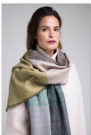
Karigar auf der internationalen Designmesse blickfang Stuttgart (1).jpg