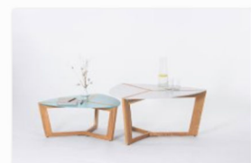
Studio-t auf der internationalen Designmesse blickfang Stuttgart (2).jpg