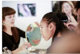
blickfang Stuttgart 2018 (3).jpg