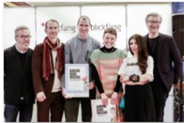
blickfang Stuttgart 2018 (1).jpg

Bildmaterial zur kostenfreien Verwendung finden Sie auf unserer Website unter www.blickfang.com/presseportal/stuttgart.html , der Fotocredit lautet © blickfang .