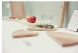
blickfang Stuttgart 2018 (7).jpg