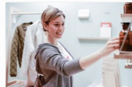
blickfang Stuttgart 2018 (8).jpg