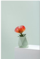
Frau Klarer auf der internationalen Designmesse blickfang Hamburg (1).jpg