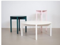
Lukas Klingsbichel auf der internationalen Designmesse blickfang Hamburg (1).jpg