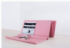
werktag auf der internationalen Designmesse blickfang Hamburg(1).jpg