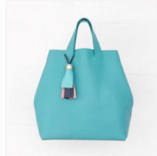
ffil auf der internationalen Designmesse blickfang Hamburg.jpg