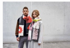
woollaa auf der internationalen Designmesse blickfang Hamburg (2).jpg