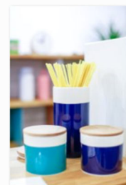
internationale Designmesse blickfang Basel 2018 (12).jpg