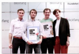
Designpreisgewinner und Jury blickfang Basel 2018.jpg

www.blickfang.com/presseportal/basel.html , der Fotocredit lautet © blickfang . Bitte nennen Sie bei Veröffentlichung auch den im Bildtitel angegebenen Designer.