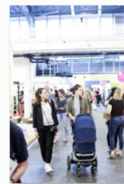
internationale Designmesse blickfang Basel 2018 (2).jpg