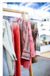
internationale Designmesse blickfang Basel 2018 (11).jpg