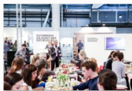
Designtalk der blickfang Basel 2018 (1).jpg