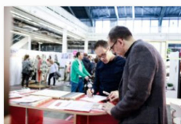
internationale Designmesse blickfang Basel 2018 (3).jpg