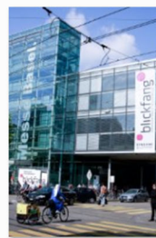
internationale Designmesse blickfang Basel 2018 (1).jpg