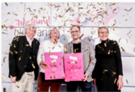
Designpreis Verleihung der internationalen Designmesse blickfang Basel 2017

www.blickfang.com/presseportal/basel.html , der Fotocredit lautet © blickfang . Bitte nennen Sie bei Veröffentlichung auch den im Bildtitel angegebenen Designer.