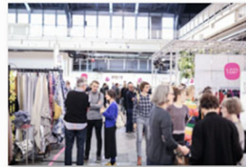
internationale Designmesse blickfang Basel 2017 (8).jpg