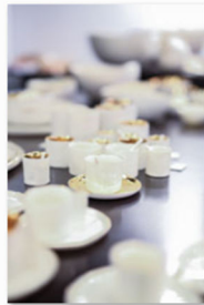
internationale Designmesse blickfang Basel 2017 (7).jpg