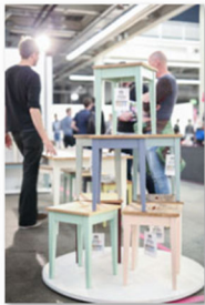
internationale Designmesse blickfang Basel 2017 (6).jpg