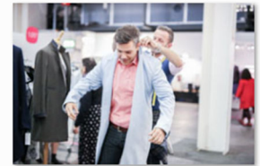
internationale Designmesse blickfang Basel 2017 (9).jpg