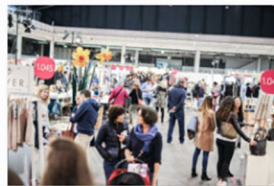
internationale Designmesse blickfang Basel 2017 (2).jpg