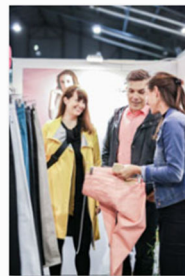
internationale Designmesse blickfang Basel 2017 (3).jpg