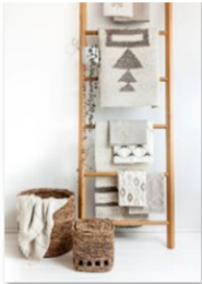
Artha Collections auf der internationalen Designmesse blickfang Basel.jpg

www.blickfang.com/presseportal , der Fotocredit lautet © blickfang . Bitte nennen Sie bei Veröffentlichung auch den im Bildtitel angegebenen Designer.