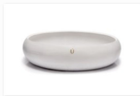
Unrefined auf der internationalen Designmesse blickfang Basel (1).png