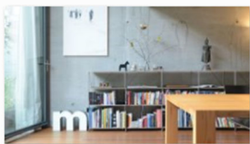
THISMADE auf der internationalen Designmesse blickfang Basel (1).jpg