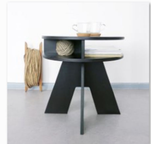
poimia kukkiaauf dem Designers Market by blickfang.jpg