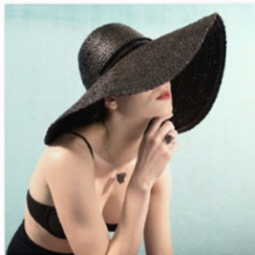
Goldmarlen am Designers Market by blickfang (3).jpg