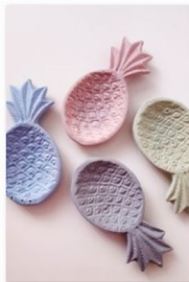
Concrete Jungle auf dem Designers Market by blickfang (1).jpg