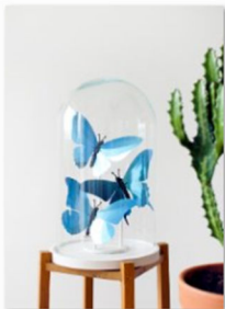
Assembli auf dem Designers Market by blickfang.jpg

der Fotocredit lautet © blickfang . Bitte nennen Sie bei Veröffentlichung auch den im Bildtitel angegebenen Designer.