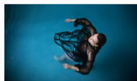
Mueller & Consorten auf dem Designers Market by blickfang.jpg