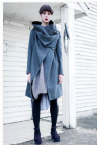
Lalica auf dem Designers Market by blickfang.jpg