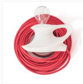
ferdinand auf dem Designers Market by blickfang (2).jpg