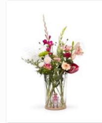
Ontwerpduo an der internationalen Designmesse blickfang Bern Foto Jeroen van der Wielen(2).jpg