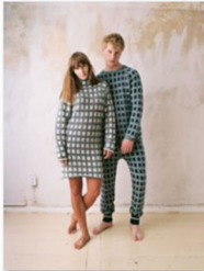
Annamariaangelika an der internationalen Designmesse blickfang Bern (2).jpg

Bildmaterial zur kostenfreien Verwendung finden Sie auf unserer Website unter www.blickfang.com/presseportal , der Fotocredit lautet © blickfang . Bitte nennen Sie bei Veröffentlichung auch den im Bildtitel angegebenen Designer.