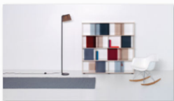
performa an der internationalen Designmesse blickfang Bern.jpg