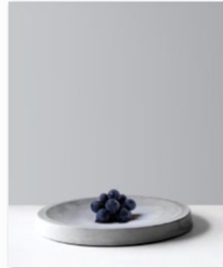
Hjem an der internationalen Designmesse blickfang Bern (3).jpg