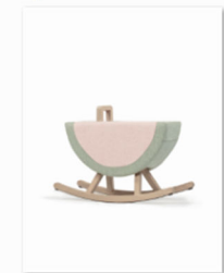
Maison Deux an der internationalen Designmesse blickfang Bern (2).jpg