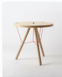
Søren Henrichsen Design Studio an der internationalen Designmesse blickfang Bern (4).jpg